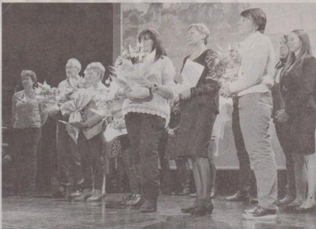
Les lauréats du concours de fleurissement 2018.